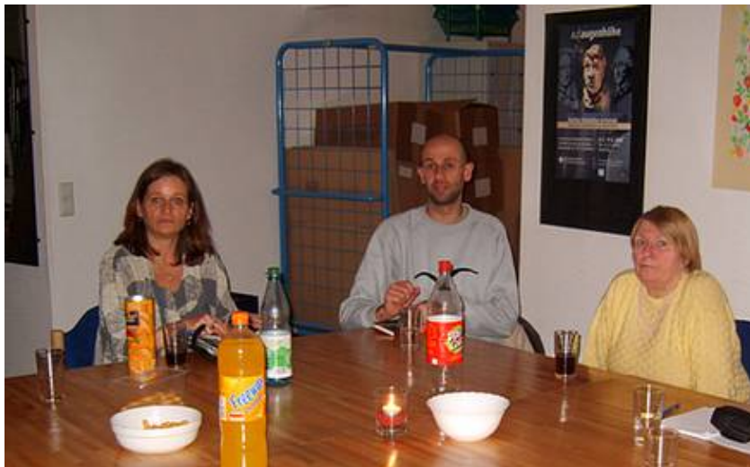
Abbildung 1: Vorbereitungstreffen